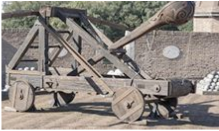
Een katapult uit de Middeleeuwen