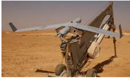
Een moderne variant van de katapult. Deze schiet kleine (onbemande) vliegtuigjes de lucht in!